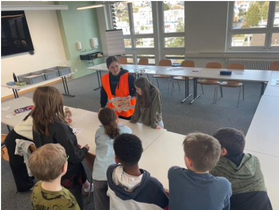
Ohren auf ...