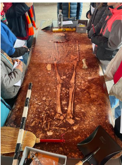
Frau oder Mann?

Mit viel Enthusiasmus tauchten die Experten mit den Schülerinnen und Schüler in die Welt ihrer faszinierenden Arbeit ein. Die Steinzeit ist die früheste Epoche der Menschheitsgeschichte. Sie ist durch erhalten gebliebenes Steingerät gekennzeichnet und begann – nach heutigem Forschungsstand – mit den ältesten als gesichert geltenden Werkzeugen vor 2,6 Millionen Jahren. Messer mit Steinklingen und Holzgriffen gehören zu den ältesten Werkzeugen überhaupt. Sie wurden sogar schon in der Altsteinzeit benutzt. Auch Löffel aus Holz, Knochen oder Geweihe gab es schon vor etwa 10'000 Jahren. Sogar einfache Kochstellen wurden gefunden.